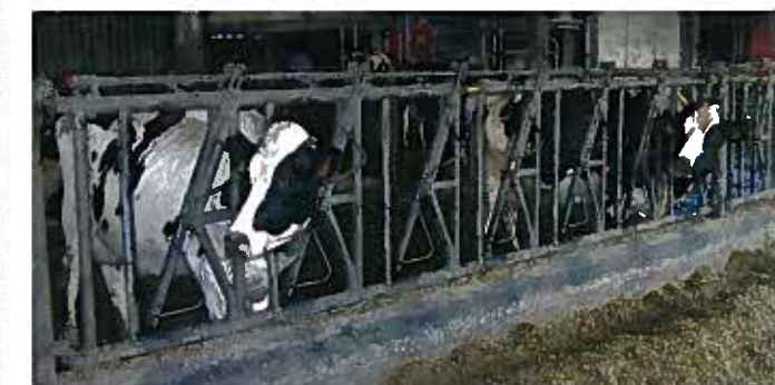
Les informations fournies par le robot sont précieuses pour surveiller le troupeau. La mesure du poids, par exemple, donne une bonne idée de l'efficacité de la ration en début de lactation.

Ce concept d'efficacité alimentaire leur semble un bon outil pour progresser. Et ce d'autant plus que le service apporté par Keenan va jusqu'à peser chaque ingrédient lors de chaque préparation. « La machine calcule le temps de mélange du fourrage grossier, ce qui permet d'obtenir une longueur de brins optimale pour la paille, sans broyer le maïs », apprécie Loïc. En outre, toutes les informations sont enregistrées sur une clé informatique. Elles peuvent être transmises au technicien, ce qui permet d'ajuster la ration. Ce suivi coûte 1 500 €/an, mais les éleveurs pensent le rentabiliser par les gains sur l'efficacité alimentaire et l'état sanitaire du troupeau. ■ PASCALE LE CANN